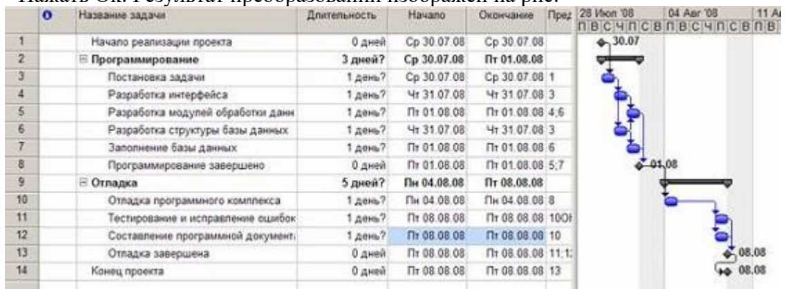
Рис. Результат преобразований